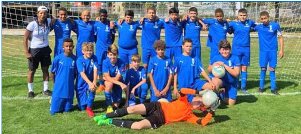
Mannschaft FC Bözingen 34 Junioren C: Aufstieg in die 1. Stärkeklasse 😊

J'ai une très bonne impression du FC Boujean 34.