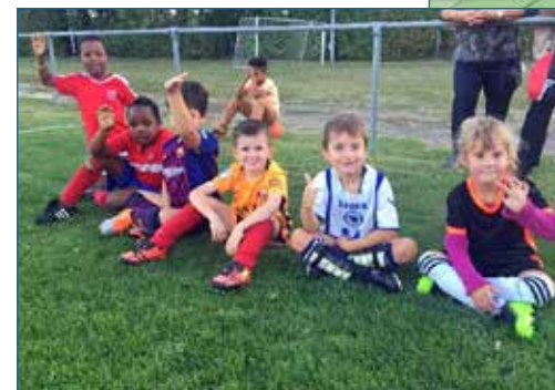
Stimmungsbilder der Bambinis im Einsatz